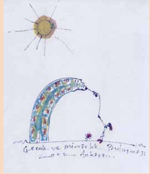
Desen: Sükriye Sarı