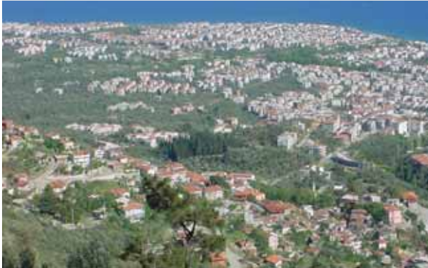
Kıyı- orman kenarı yapılaşma Altınoluk/Balıkesir