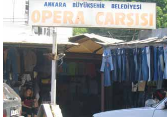
Atatürk Bulvarı Köprü Altlarında Düzensiz Çarşı Oluşumları

Ulus Meydanı: Önemi tarihi kent merkezinde, Gar ve Kale ilişkisini sağlayan bir aks üzerinde olması nedeniyle. Meydanı çevreleyen yapılar -Kurtuluş Savaşı Müzesi, İş bankası, Sümerbank- mimarlık tarihi açısından önemlerinin yanı sıra, her biri bir dönemin politikasını yansıtmaktadır ve bu nedenle yapılar arasında bir anlam bütünlüğünden söz etmek mümkündür. Ulus Heykeli meydanın en önemli öğesidir. 100. Yıl Çarşısı'nın kapatılmış zemin kat açık alanı ile Ulus İş Hanı avluları meydan ile doğrudan ilişkili bir yaya kullanımı tarifler.