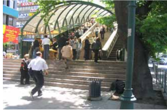
Atatürk Bulvarı Yaya Üst Geçiti

mektedir. Meydanın yayalar için sadece bir geçiş alanı niteliğinde kurgulanmış olması ve çevredeki yoğun taşıt trafiği bugün önemli bir problemdir.