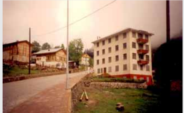
Ayder Yaylası- yeni yapılaşma / Rize

alanları üzerindeki kaçak yapılaşma ile adeta kentler kurulmuştur ( İstanbul Çavuşbaşı, Adana Tekir yaylası gibi). İlk imar affını içeren yasanın çıktığı 1945 yılından bu yana onlarca yasa çıkarılmıştır. Tüm yasaların özü, mevcudu affetmek olmuş, ileriye dönük önleme 11 amacı hiçbir zaman gerçekleşmediği gibi, aksine yeni işgaller için cesaret vermiştir.