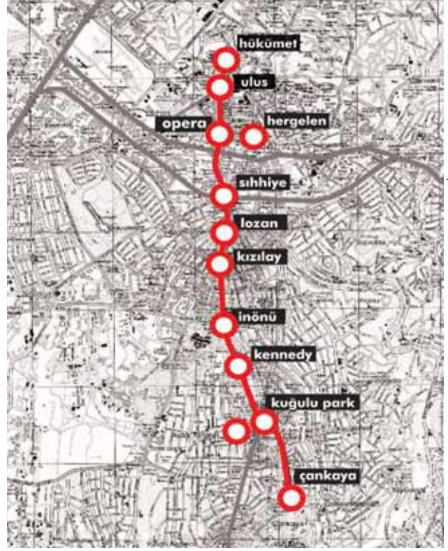
Ankara Atatürk Bulvarı /Meydanlar

Kenedi Meydanı: Çağdaş Sanatlar Merkezi ile ilişkilendirilmiş meydan aynı zamanda dokunun değiştiği, Elçiliklerin başladığı bir odaktır. İş Bankası ve TRT Binası ile tanımlanmış meydan da yapılan yeni taşıt trafiği düzenlemesi büyük bir karmaşa yaratmış, yayalar için kullanımı zorlaştırmıştır.