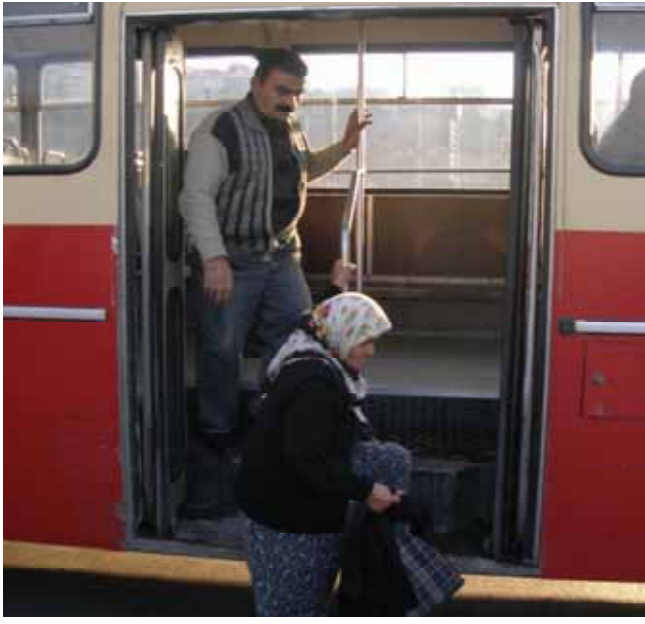
Kadınların kent içi ulaşımı

Kadının kent içindeki yaşamının önemli konularından biri tüketim mekanlarıdır. Kentlerimizde hızla çoğalan alışveriş merkezleri de ulaşılabilirlik sorununun kadınlar açısından yeniden irdelenmesini gündeme getirmektedir. Bu anlamda da planlamanın girdi olarak alacağı veriler önem kazanmaktadır.