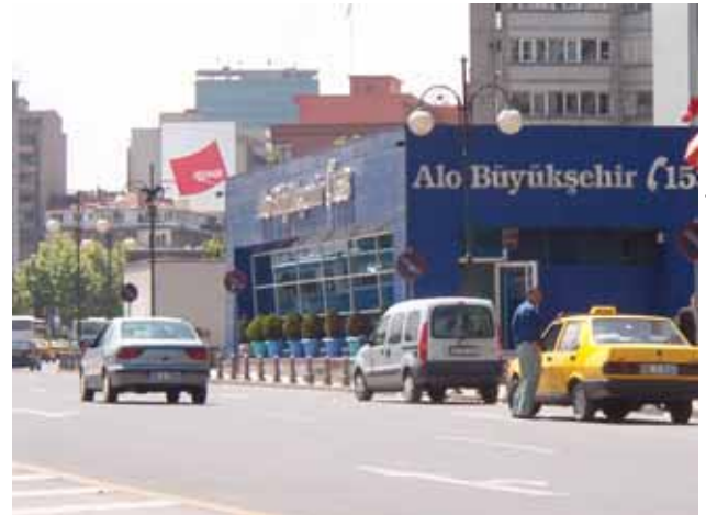
Atatürk Bulvarı Beyaz Masa

mez pek çok değişime -salt taşıt yolu olarak kabul görmesi, taşıtlar için sonsuz sayıda altgeçitler inşa edilerek kent algısının imkansız hale getirilmesi, tümü sağlıklı bireyler olarak değerlendirilen yaya- ların üst kotlara alınması ve bu nedenle her biri birbirinden farklı ve çirkin, kentin 3. boyut görünümünü kesintiye uğratan üst geçitler inşa edilmesi, meydanların taşıdıkları büyük potansiyellere karşın birer taşıt aktarım odağı olarak düzenlenmesi ve hatta yaya kullanımından arındırılmak istenmesi, meydanlarla ilişkili yeşil alanların bilinemez uygulamalara konu kılınması ya da kullanım dışı bırakılması ve giderek köhneleşmesi, taşıt ulaşım köprülerinin ticari bir alan olarak ele alınması ve zemin kotlarının ticari faaliyetlere ayrılması gibikonu olmuştur. Bu değişim Ankara'nın kimliğini tanımlayan “modern”, “çağdaş”, “düzenli”, “sakin”