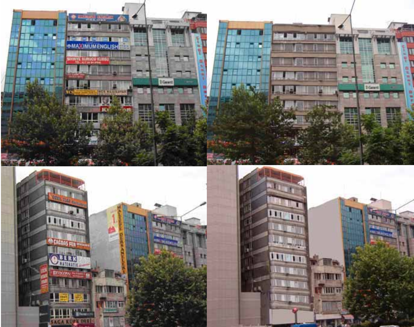
Atatürk Bulvarı'nda Tabelalardan Arındırılmış Cepheler

- yerlerinin yaya hareketlerini zorlaştırmayacak biçimde, tesadüfi değil, çevre verilerinden hareketle saptanması gerekmektedir.