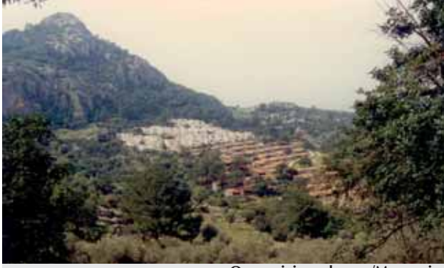
Orman içi yapılaşma /Marmaris