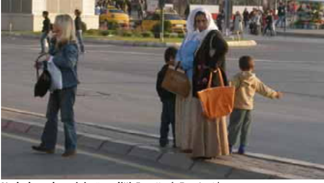
Kadınların kent içi güvenliği

eğitim ve sağlık hizmetlerinden eşit yararlanma, göç ve yoksulluğun önlenmesi, eşitlik için zihniyet değişikliği ve farkındalık yaratmadır. 13