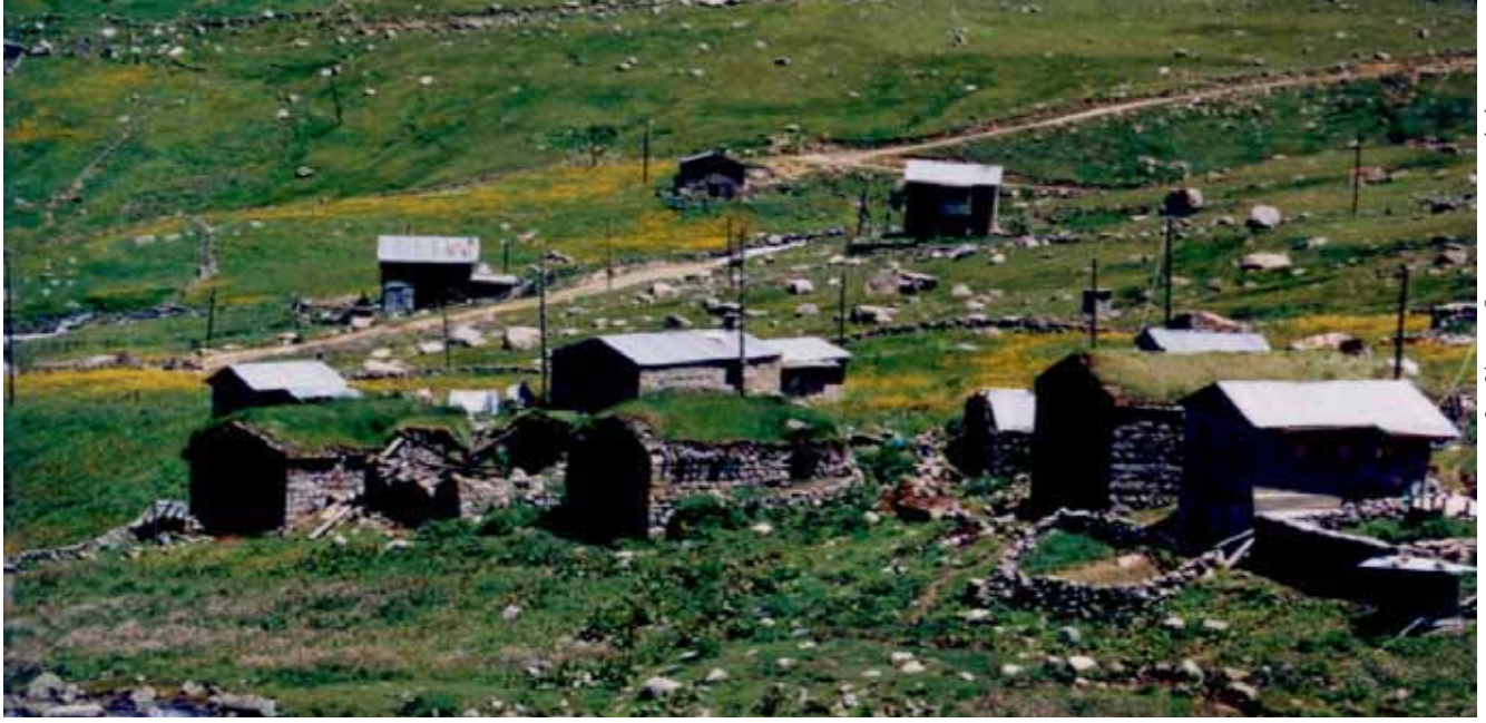
Karadeniz yaylaları/Rize

rıcalıklı imar haklarının verilmesini sağlayan düzenlemelere yer verilmiş, 1/25.000 ölçekli çevre düzeni planını onaylama yetkisini Bayındırlık ve İskan Bakanlığı, imar planlarının onaylanmasında da Kültür ve Turizm Bakanlığı yetkili kılınmıştır.