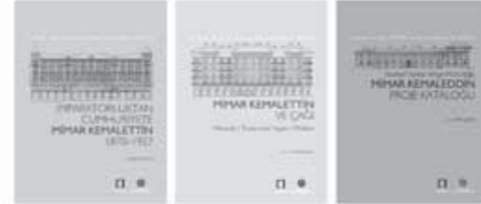
İmparatorluktan Cumhuriyete Mimar Kemalettin 1870-1927