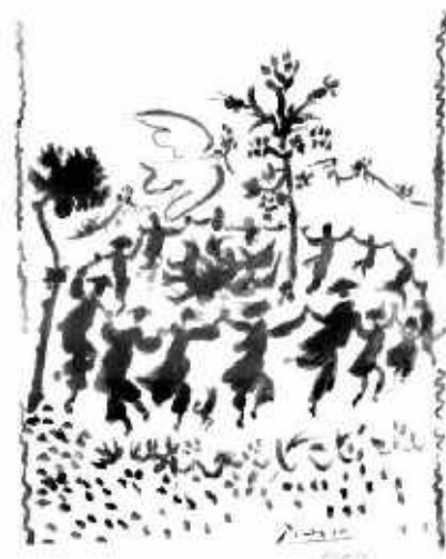
"Dance for Peace" Pablo Picasso