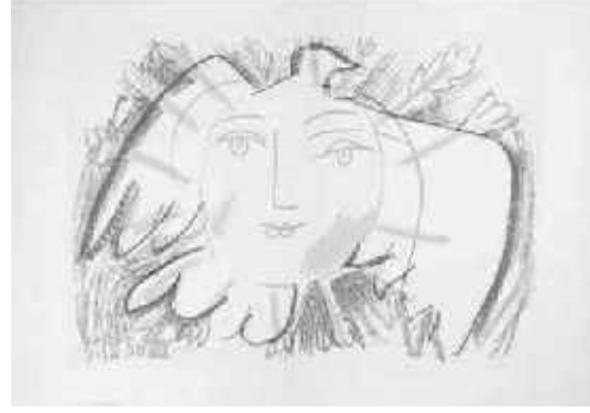
"Barışın Yüzü" Pablo Picasso