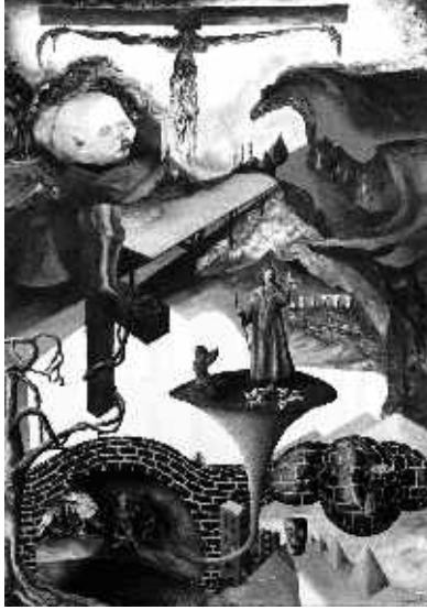
"Barış" E.W. Powell