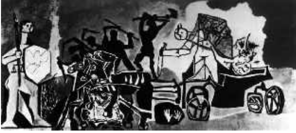
"Savaş" Pablo Picasso